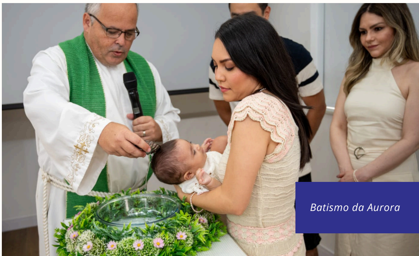
Batismo da Aurora